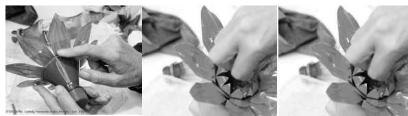
DOY FORMAY COLOR