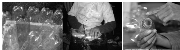
ALISTO EL MATERIAL