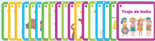
5 Fichas factores de riesgo (10 cm x 12 cm)