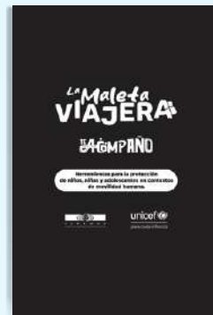
12 Arte maleta viajera un solo color (21,5 cm x 13,9 cm)