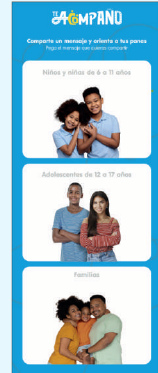
7 Banner mensaje para mis panas (40 cm x 100 cm)