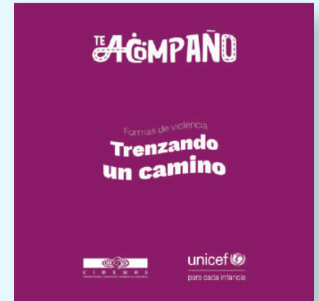
14 Trenzando un Camino Bolsas ilustrativas del Rompecabezas (38,1 cm x 38,1 cm)