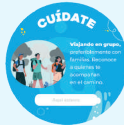
6 Adhesivos Viajeros (14 cm x 14 cm)