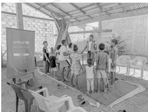
Ilustración 2. Tablero de La Escalera

Paso 5: El juego terminará a medida que los y las participantes lleguen a la meta.