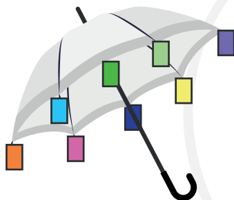
Ilustración 3. Sombrilla de colores

Paso 5: El juego finalizará cuando se lean todas las tarjetas dispuestas en los sobres. Por último, el(la) profesional contará las cartas que cada uno(a) ha recolectado. El(la) participante con más, será reconocido(a) como “la persona de los mil colores” y tendrá la posibilidad de realizar una pregunta a cualquier persona del grupo.